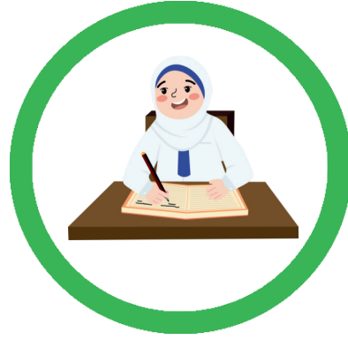
HÖFLICH MITARBEITEN UND MITDENKEN