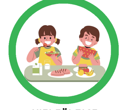
VIelfÄLTIGE GESUNDE JAUSE