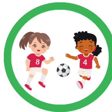
GEMEINSAM MIT GRENZEN SPIELEN