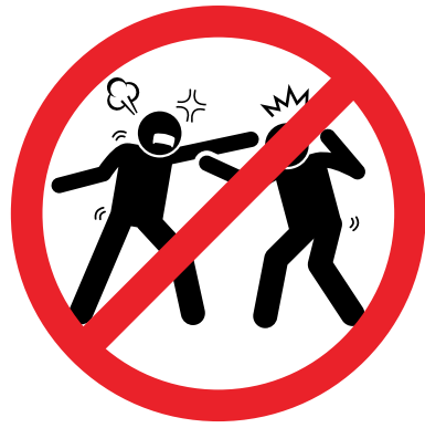
KEINE GEWALT KEINE KÖRPERLICHEN ÜBERGRIFFE