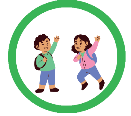
FREUNDLICH UND OFFEN SEIN ANDERE BEGRÜßEN