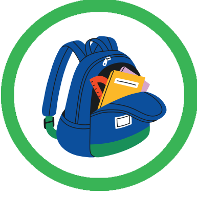
SCHULTASCHE UND SCHULSACHEN MITNEHMEN