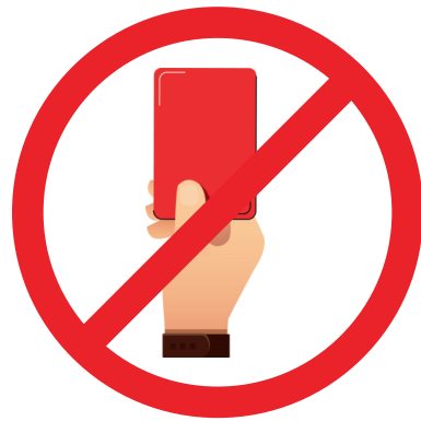
KEIN WILDES SPIELEN UND ANDERE GEFÄHRDEN