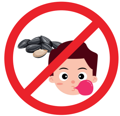
KEIN KAUGUMMI UND SONNENBLUMENKERNE