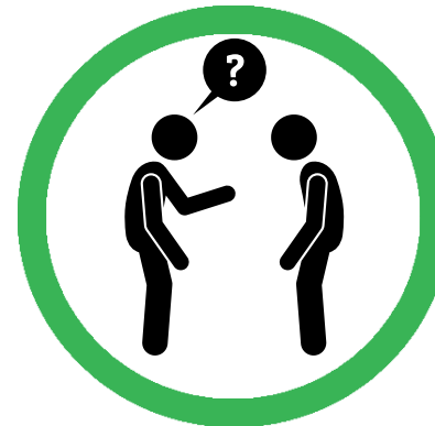
UM ERLAUBNIS FRAGEN