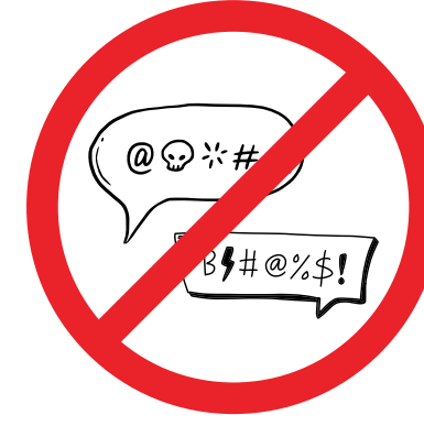
KEINE SCHIMPFWÖRTER UND BESCHIMPFUNGEN