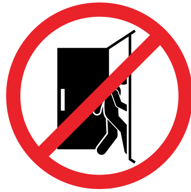
KEIN VERLASSEN DER KLASSE ODER SCHULE