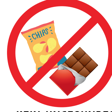
KEIN UNGESUNDES FAST FOOD