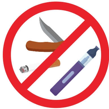
NICHTS GEFÄHRLICHES KEINE SUCHTMITTEL