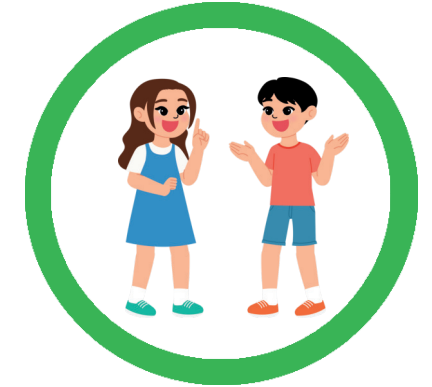
RUHIG UND RESPEKTVOLL SPRECHEN