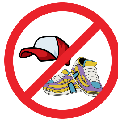
KEINE HAUBEN, KAPPEN, KAPUZEN UND SCHUHE IN DER KLASSE