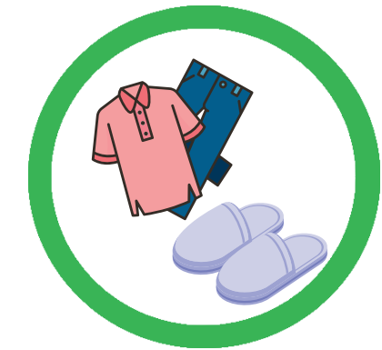
SAUBERE UND ORDENTLICHE KLEIDUNG, HAUSSCHUHE