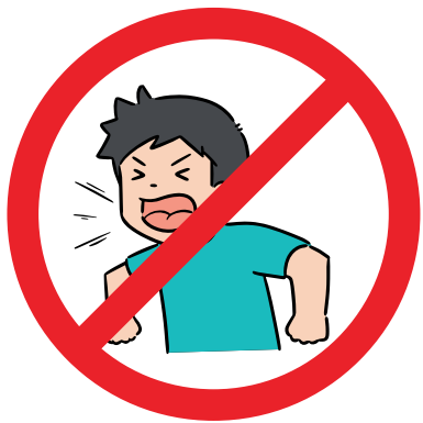
KEIN SCHREIEN UND RAUSRUFEN