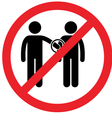
KEINE UNPASSENDE BERÜHRUNGEN