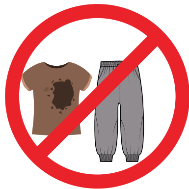
KEINE JOGGINGHOSEN UND SCHMUTZIGE KLEIDUNG