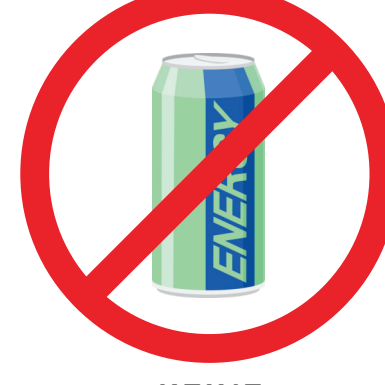
KEINE ENERGY DRINKS