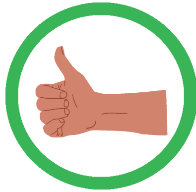
HÄNDE UND FÜßE BEI MIR LASSEN